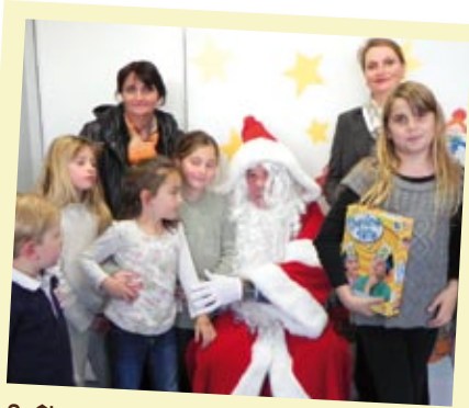
Goûter de Noël pour les enfants de l'Accueil de Loisirs Sans Hébergement