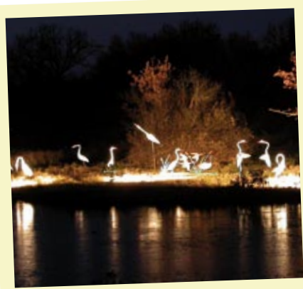
Les "oiseaux au port", illuminations réalisées par le personnel communal