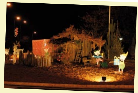
Décorations de Noël imaginées et créées par les services de la ville