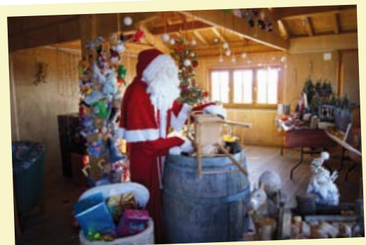
L'atelier du Père Noël à la Cabane Bleue