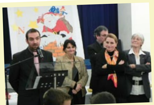
Cérémonie des vœux au personnel