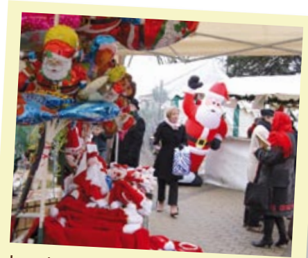
Les stands colorés du marché de Noël